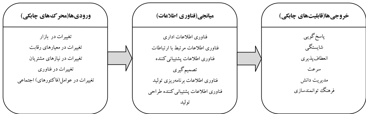
شکل ۲. مدل ارزیابی کارایی چابکی صنایع کاشی و سرامیک یزد

بر اساس مراحل تشریح شده در فوق، فرایند پژوهش به شرح شکل (۳) می‌باشد.